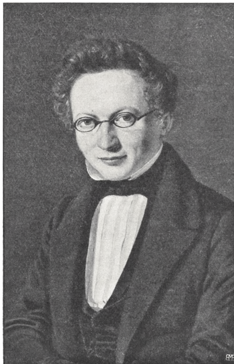
Iapetus Steenstrup Efter et Oliemaleri af en Ubekendt 1) .